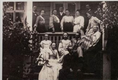
Sukujuhlat Jyväskylässä / Familjefest i Jyväskylä / Family feast in Jyväskylä, 1897