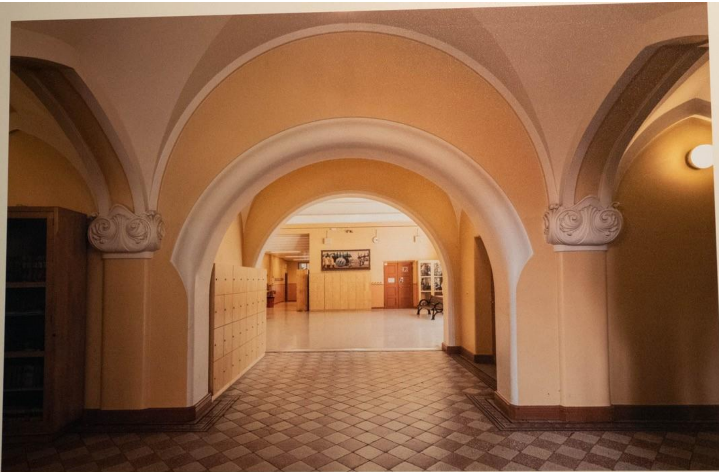
TAMPEREEN SUOMALAINEN TYTTÖKOULU 1902