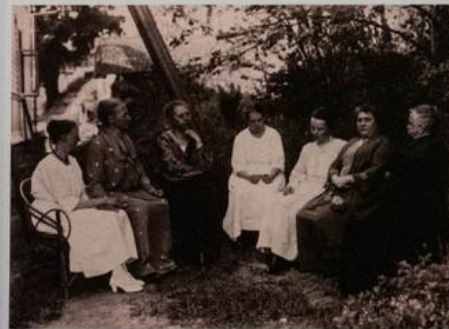
Sukujuhlat Jämsässä / Familjefest i Jämsä / Family feast in Jämsä, 1923