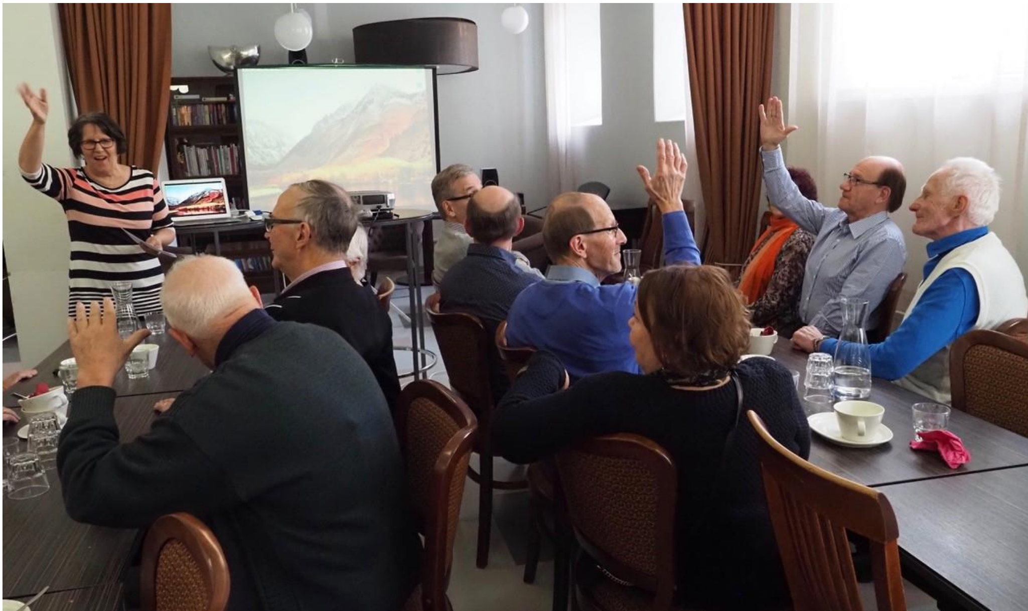
Haapaveden yhteiskoulun 100-vuotisjuhliin löytyi Me haapavetisten joukostaakin lähtijöitä.