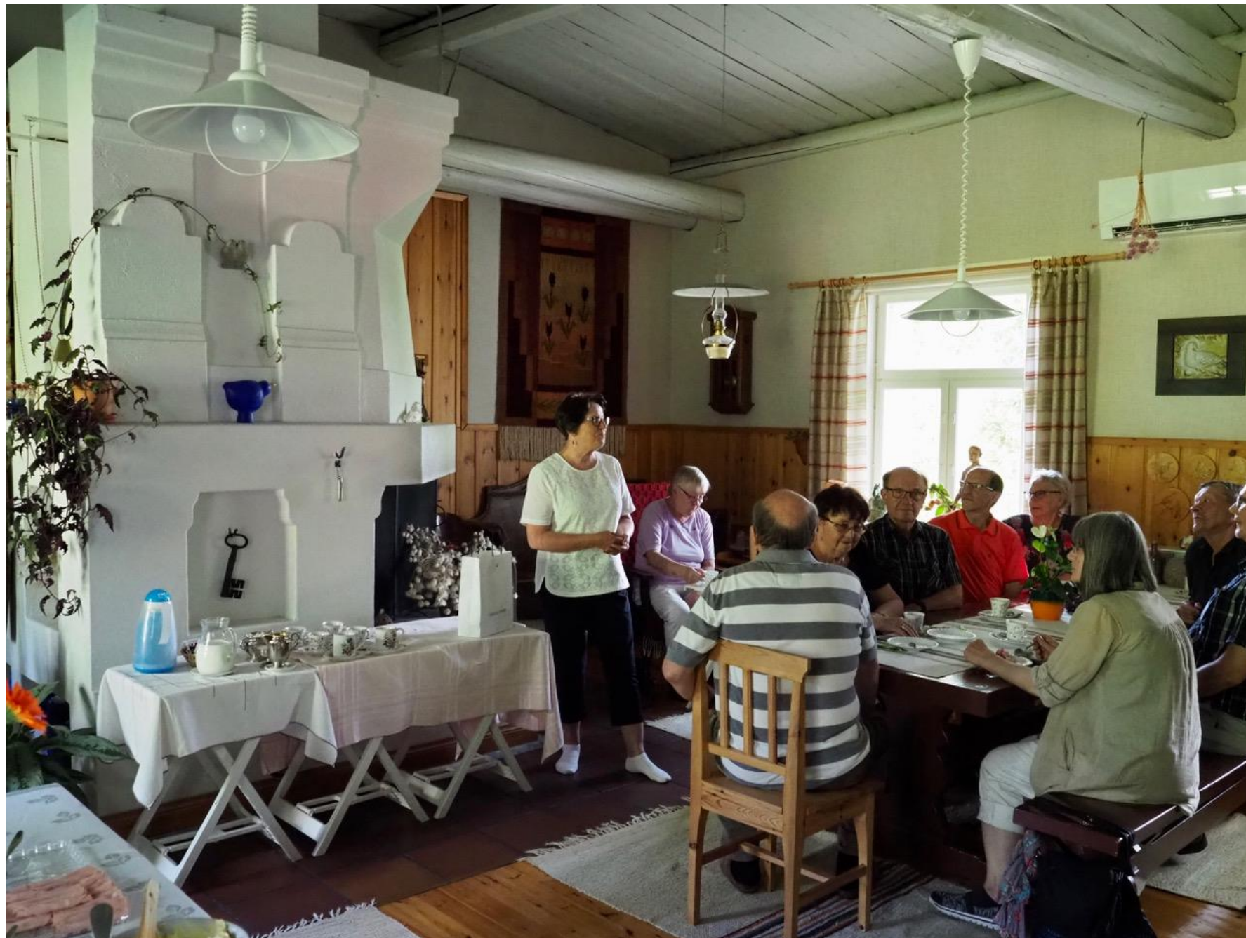
Alatalon tupaan on mm. muurattu upea ja näyttävä uuni.