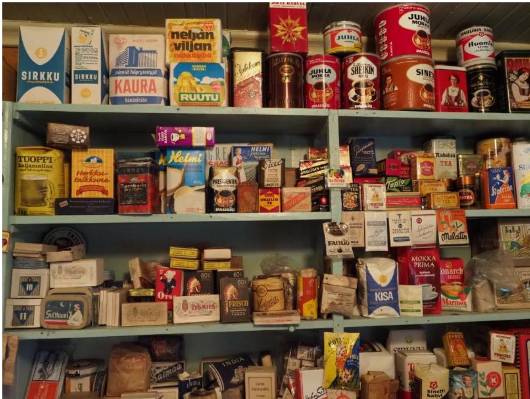
Niin moneen tarpeeseen tavaraa löytyy Pusan kaupan hyllyiltä.