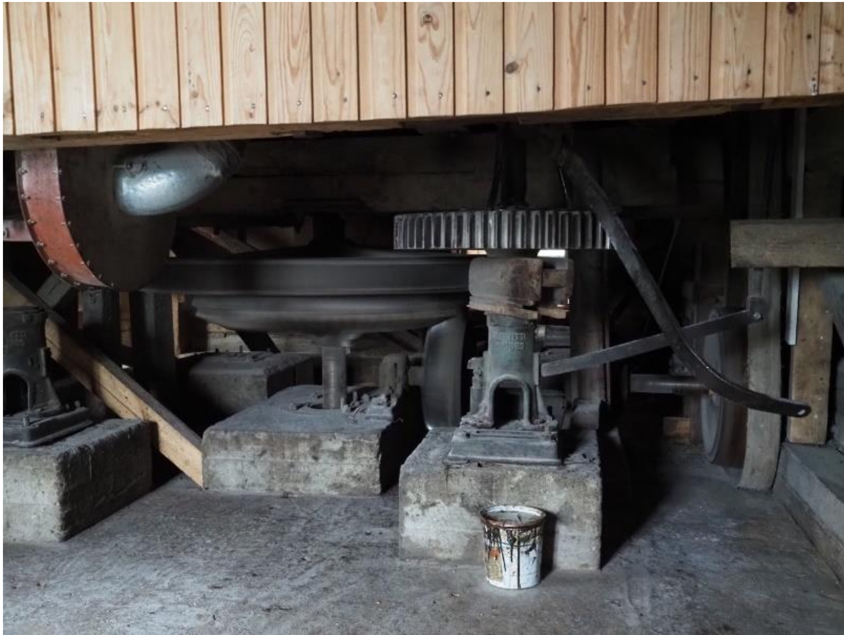
Samat myllyn rattaat ovat pyörineet lähes sata vuotta.