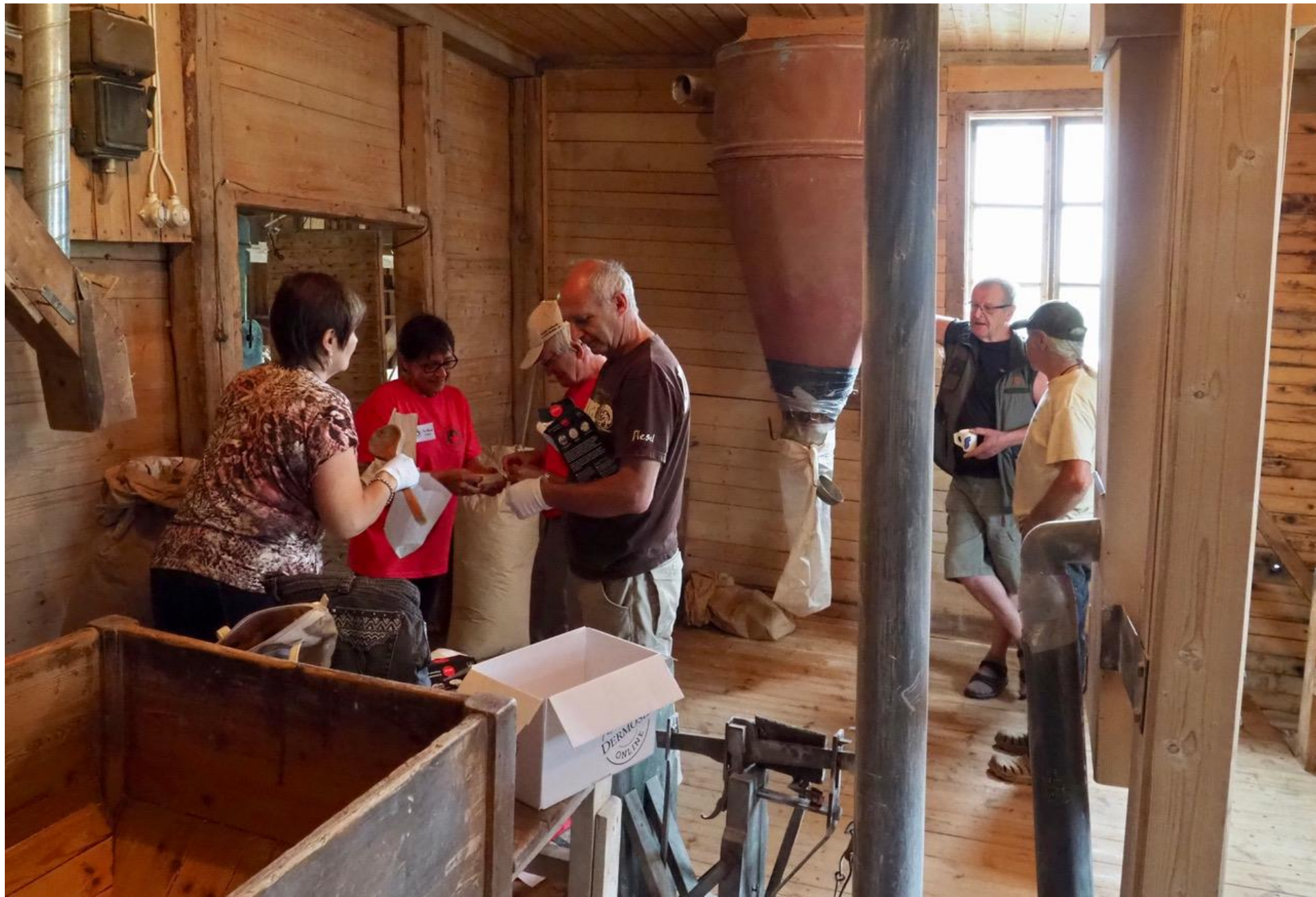
Juuri jauhetut ohraryynit pussitettiin meille kaikille tuliaisiksi.