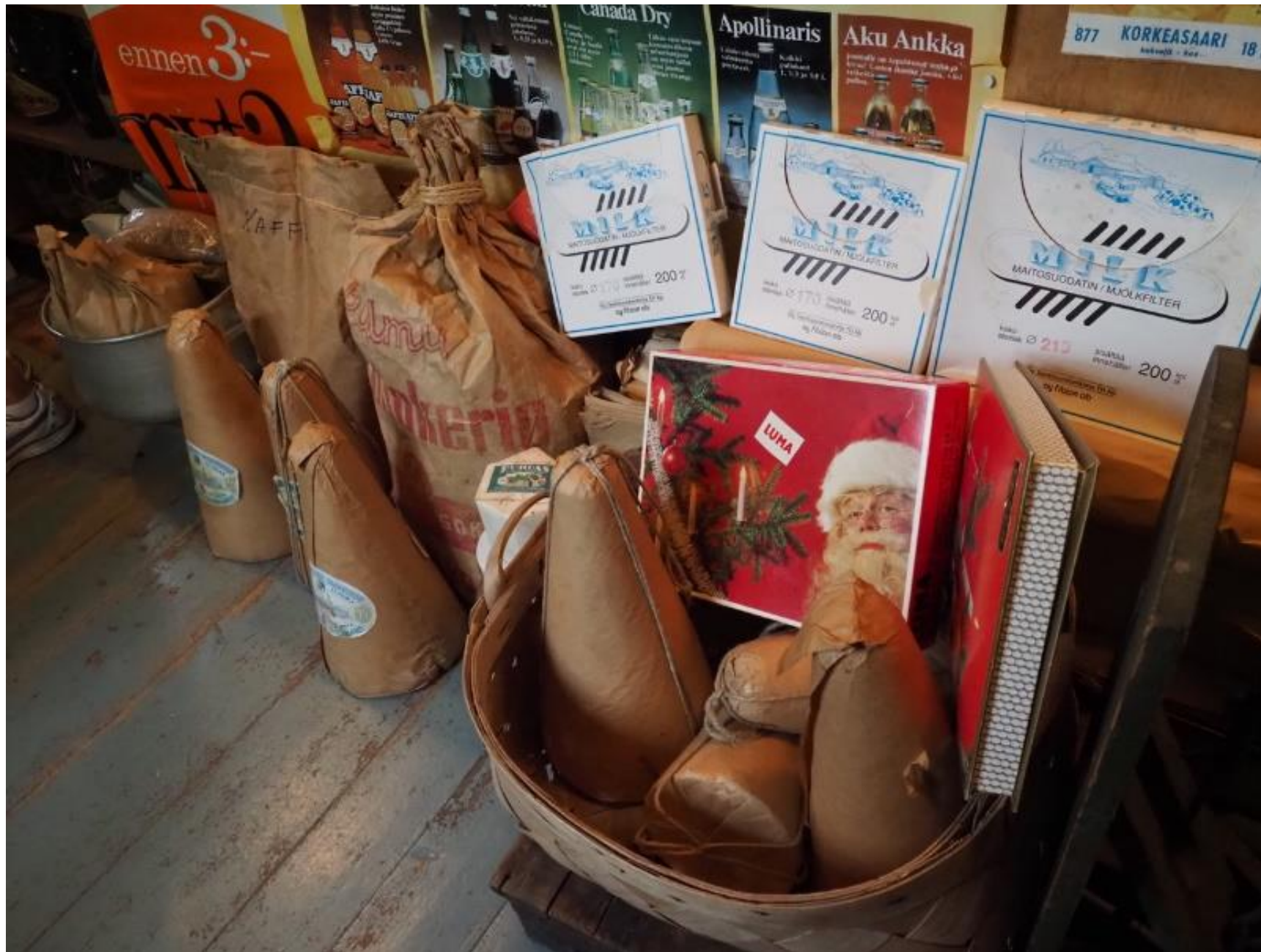
Vanhan kaupan sokeritopat. Niistä murrettiin aikanaan paloja tarpeen mukaan.