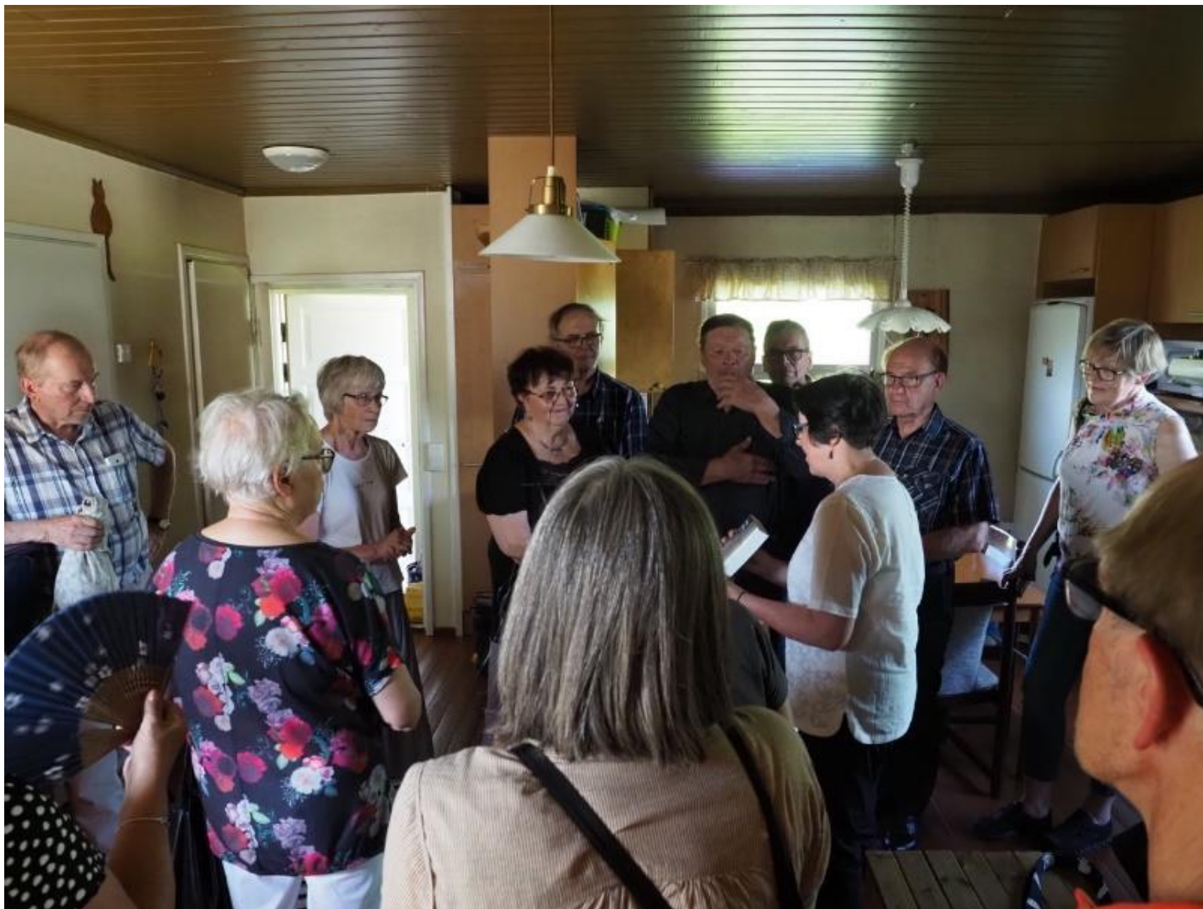
Kiitokset Outille, Haapaveden perinteen vaalijalle, että saimme vieraila Laaksoassa.