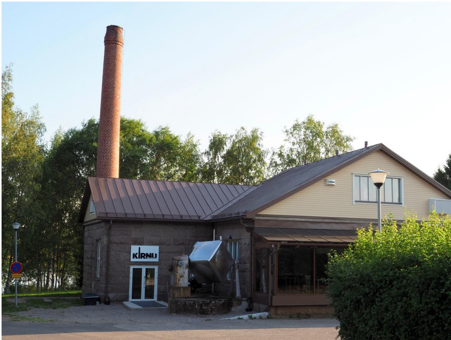
Teatteri Kirnun pihassa on kirnu, joka muistuttaa meijerin aikakaudesta.