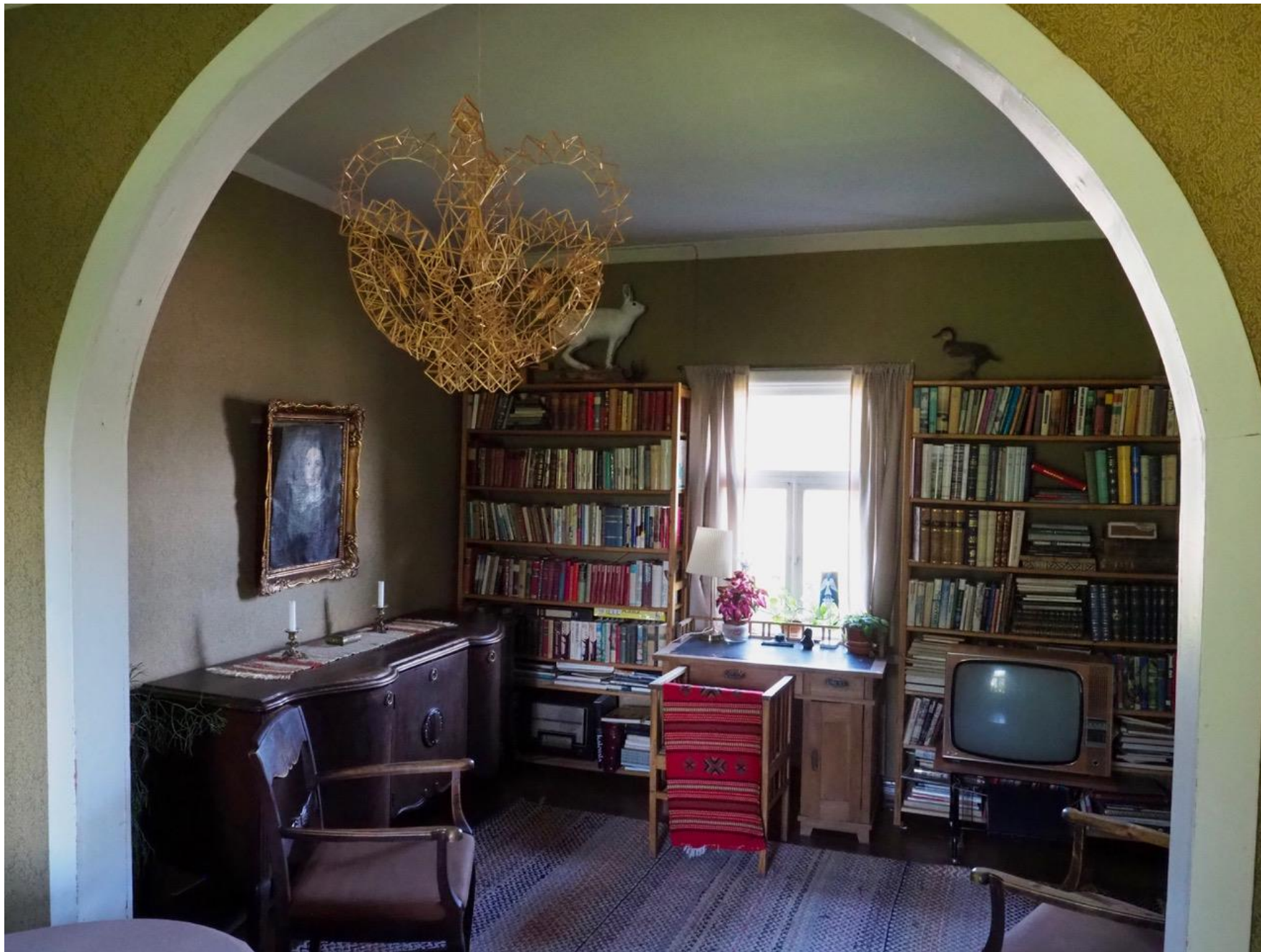
Laaksoassa näkyy eri asukkaiden tekemiä muutoksia ja tyyliuuntauksia.