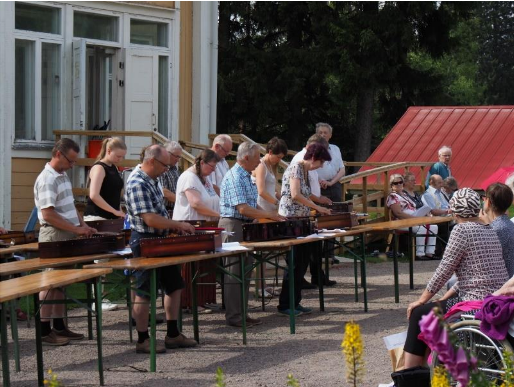
Haapaveden kanteleyhtyeen konsertti Paakkilassa päättyi Haapavesi-lauluun. "Sua synnyinkehtoani laulullani kiittää saan..."