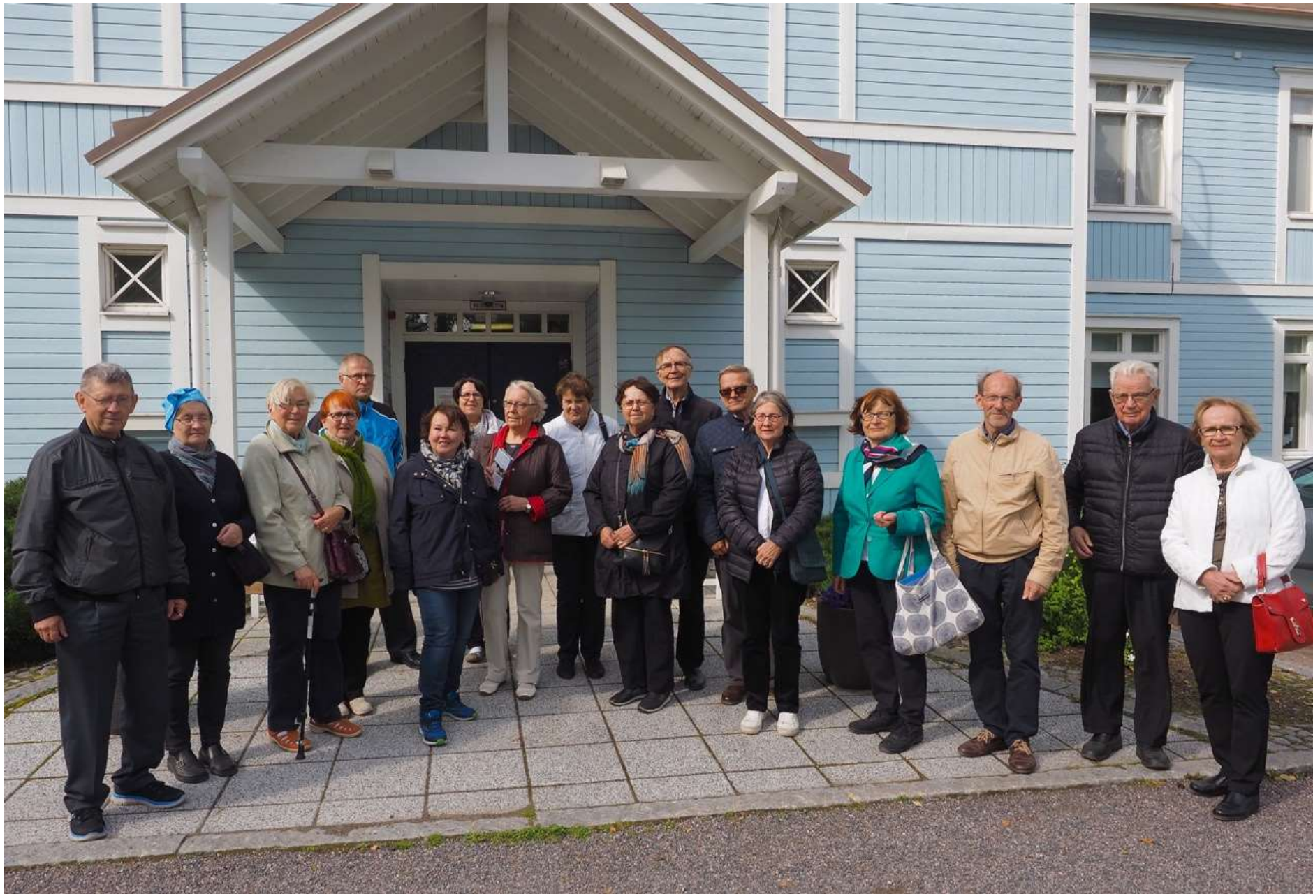
Osanottajat Lottamuseon edustalla, kuvasta puuttuu kuvan ottanut Risto Peltonen