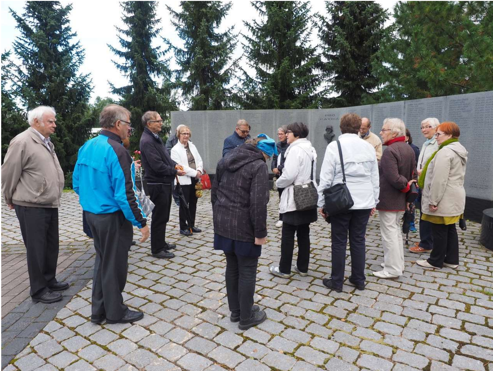
Sotavainajien muistomerkillä Tuusulan hautausmaalla