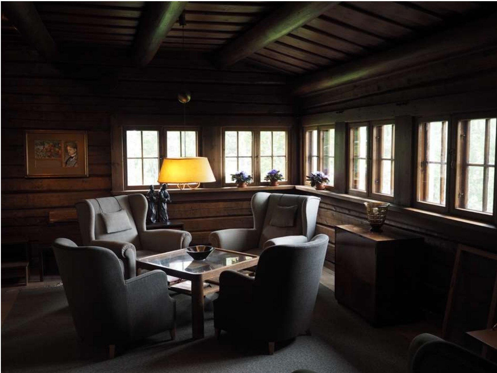
Kuvia Ainolan huoneista