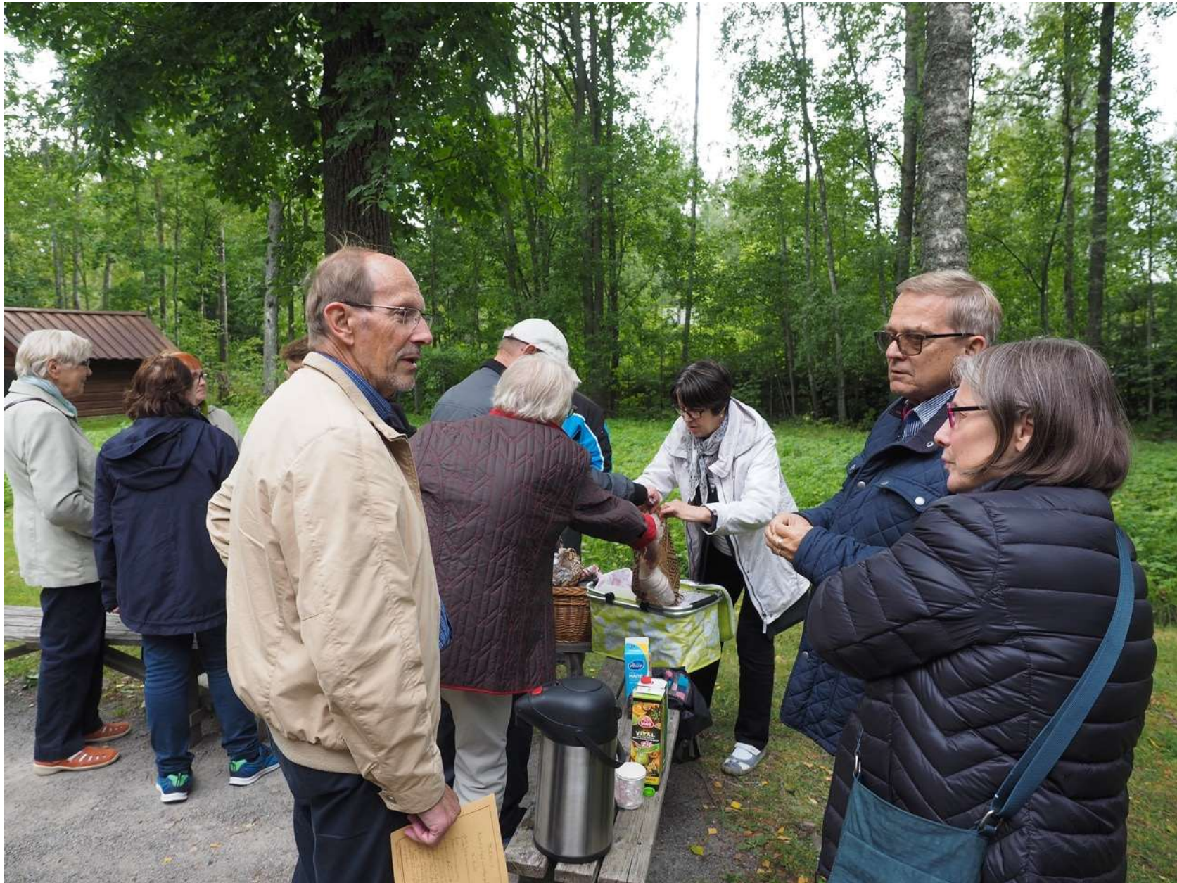
Retkikahvit Aleksis Kiven kuolinmökin pihapiirissä