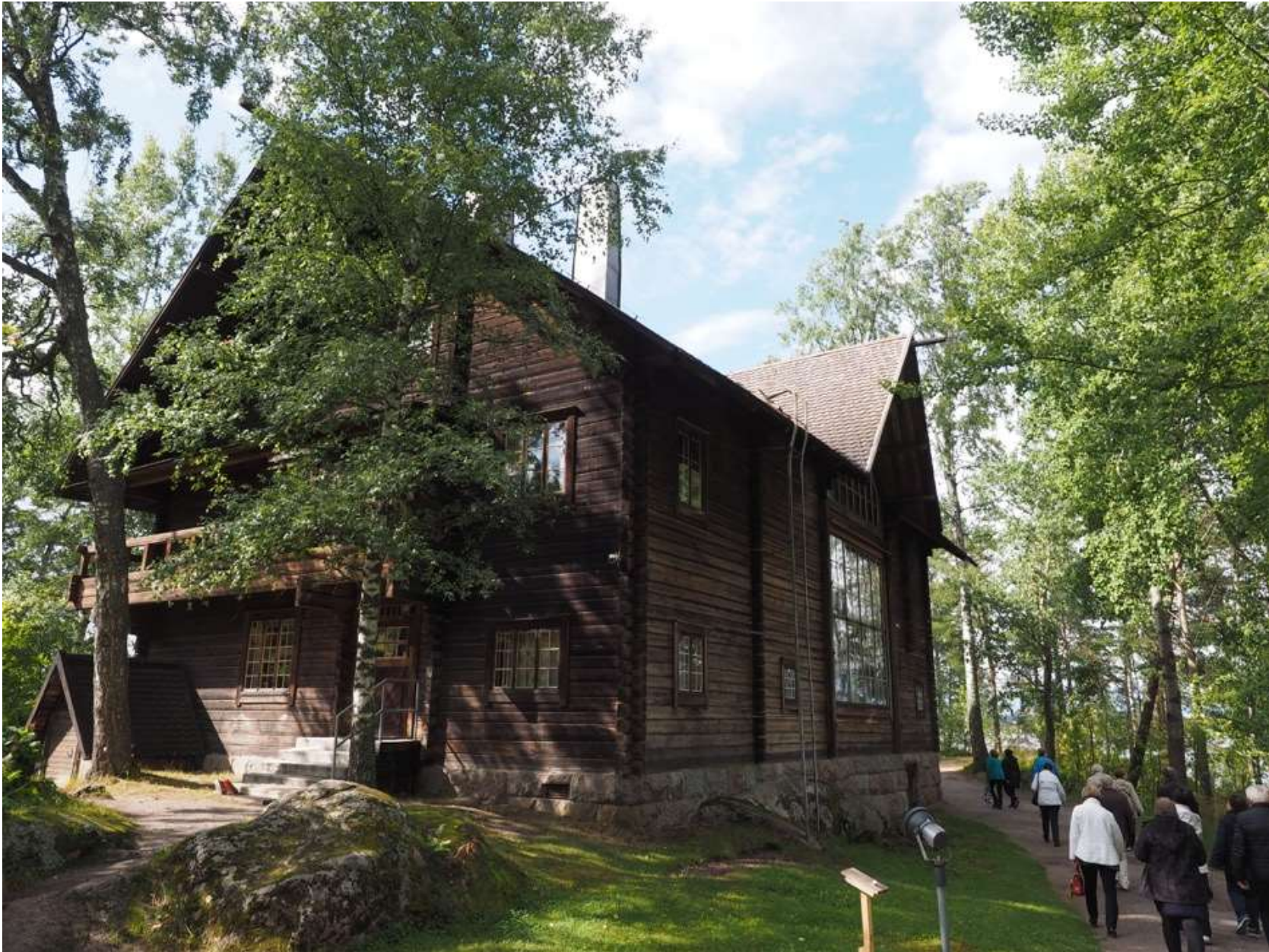
Ryhmä menossa Halosenniemeen