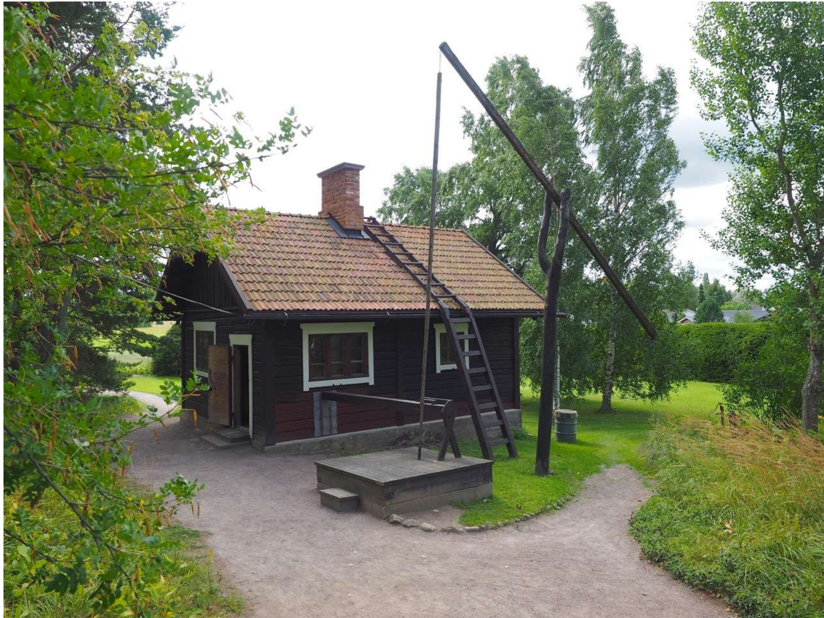
Ainolan sauna. Kaivolta johtaa puinen vesijohto saunan sisälle.