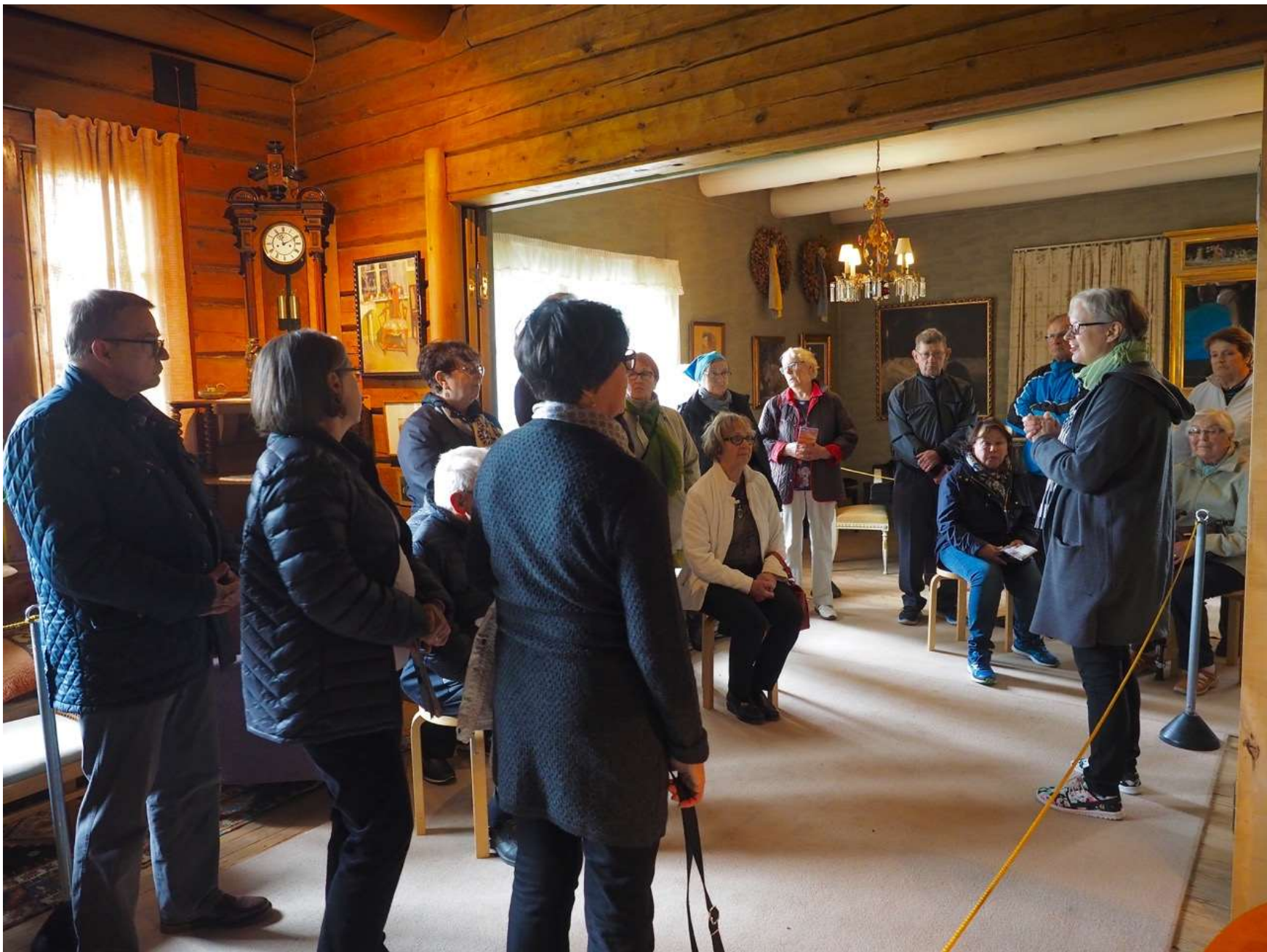
Ainolassa kuunnellaan oppaan esitystä