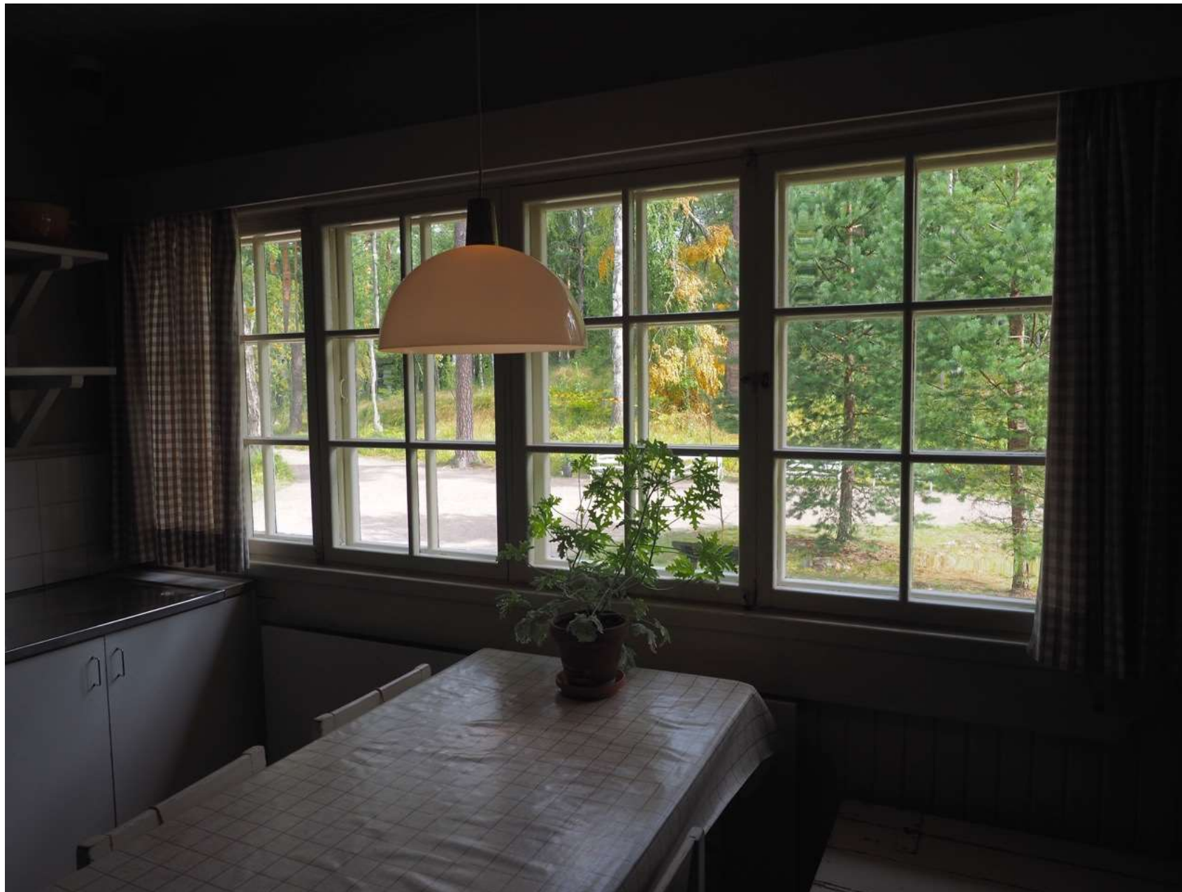
Kuvia Ainolan huoneista