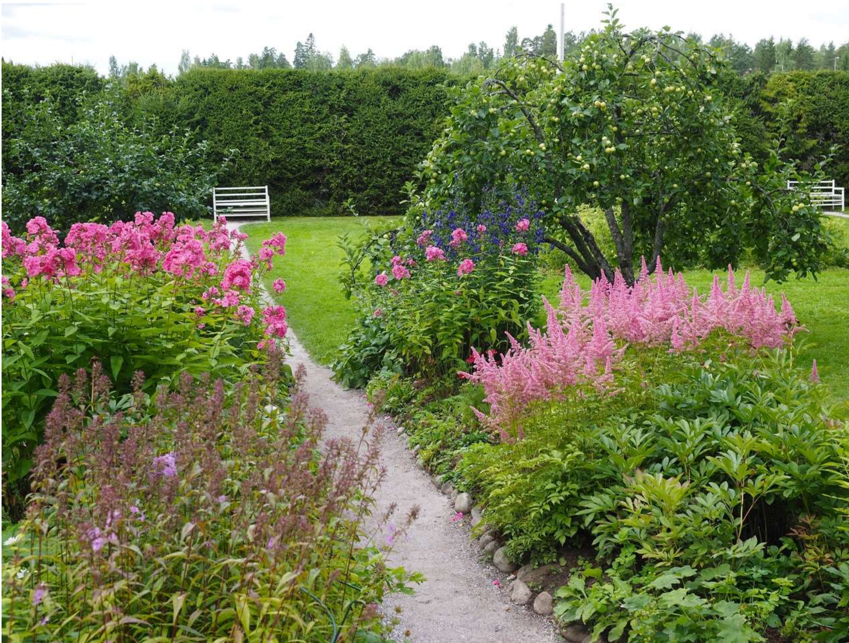
Näkymä Ainolan puistoon