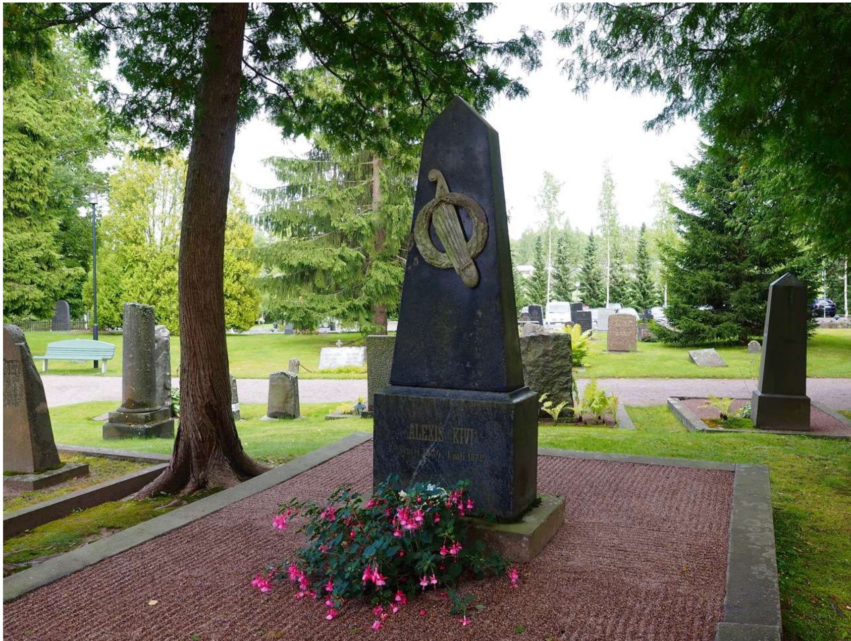
Aleksis Kiven hauta Tuusulan hautausmaalla