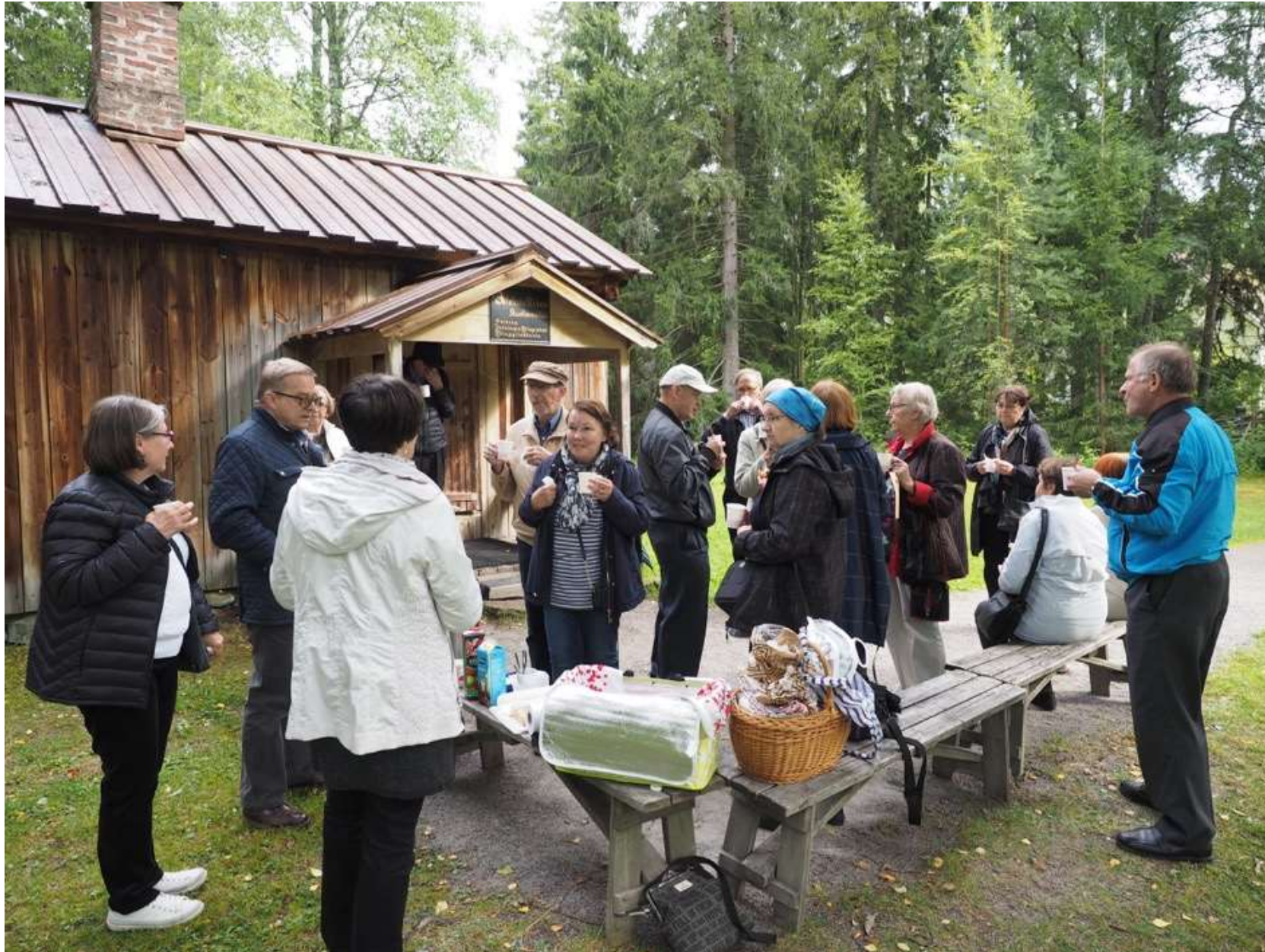
Retkikahvit Aleksis Kiven kuolinmökin pihapiirissä