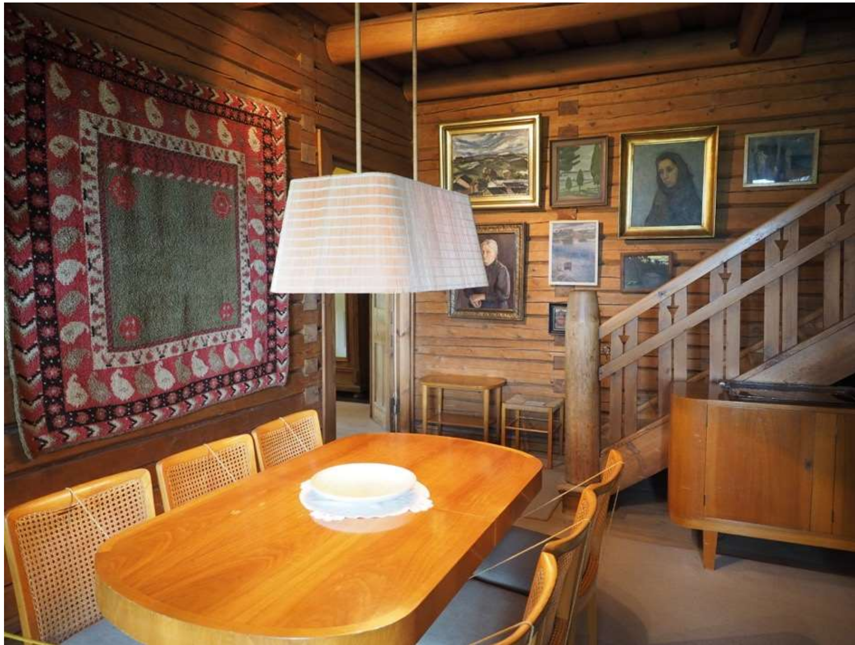
Kuvia Ainolan huoneista