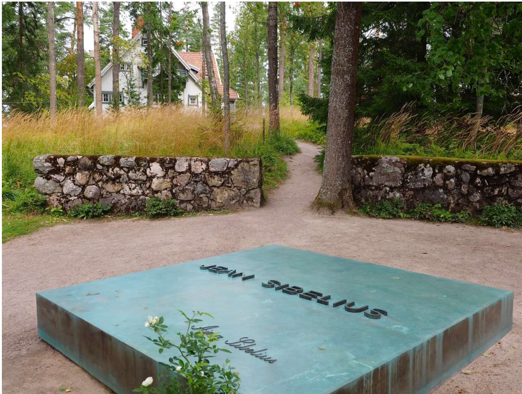
Jean ja Aino Sibeliuksen hautapaasi Ainolan puistossa